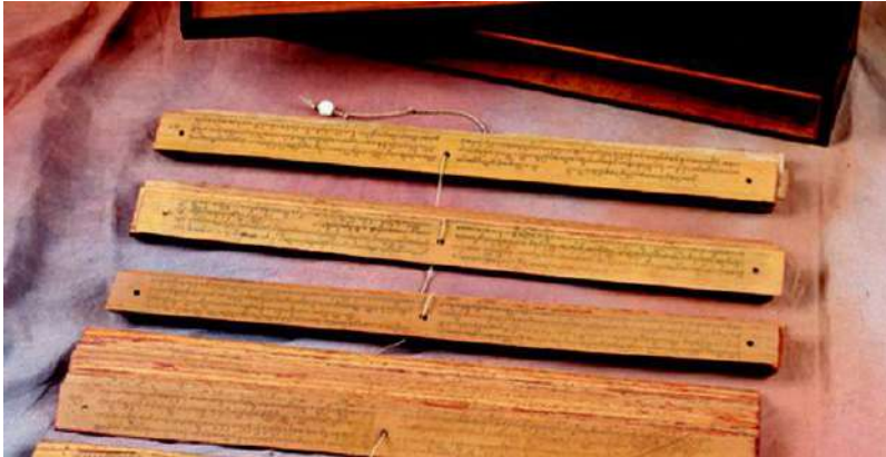
(Gambar 9.2 Arsip Negarakertagama)

Program Memori Dunia (MoW) diluncurkan oleh Organisasi Pendidikan, Keilmuan, dan Kebudayaan Perserikatan Bangsa-Bangsa (UNESCO) pada tahun 1992 dengan tujuan untuk melindungi warisan dokumenter, memfasilitasi akses, dan menyebarkan warisan dokumenter. Tahun 2022, menandai peringatan 30 tahun program Memory of World (MoW) studi mengenai hal itu masih sangat terbatas.