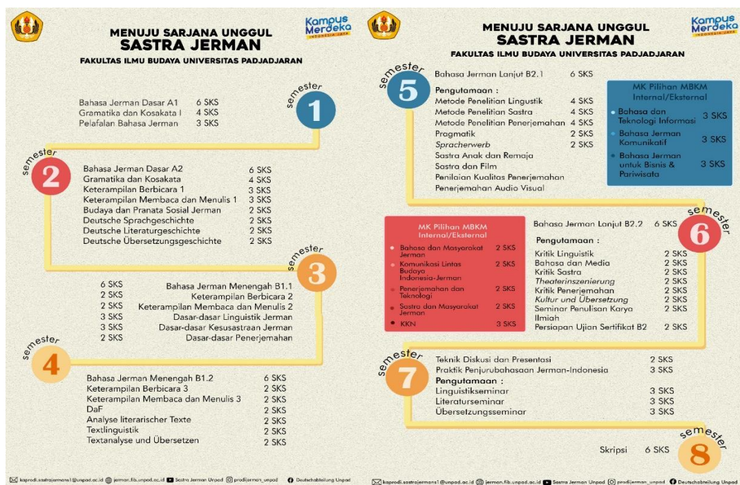
Gambar 2: Kurikulum 2021 Program Studi Sastra Jerman FIB Unpad

Di dalam kurikulum tersebut, kompetensi lintasbudaya dibahas dan dilatihkan di dalam mata kuliah bidang Bahasa dan Linguistik, yaitu di dalam mata kuliah Deutsch als Fremdsprache (Sprechen) , Interkulturelle Kommunikation , Sprache und Gesellschaft , dan Sprache und Medien . Sedangkan untuk bidang Sastra, pembahasan kompetensi lintasbudaya Einführung in die Literaturwissenschaft dan Literaturwissenschaft . Secara konkret, mahasiswa membuat proyek pementasan drama dan tentu mendiskusikan dan menginterpretasikan karya sastra yang dibahasnya. Dalam bidang Penerjemahan terdapat mata kuliah Kultur und Übersetzung yang membuka ruang diskusi lintasbudaya yang luas.