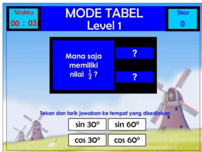
Gambar 2 Tampilan Latihan Soal